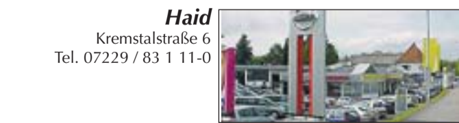
Haid Kremstalstraße 6 Tel. 07229 / 83 1 11-0