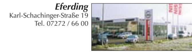
Eferding Karl-Schachinger-Straße 19 Tel. 07272 / 66 00