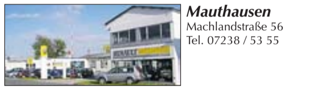
Mauthausen Machlandstraße 56 Tel. 07238 / 53 55