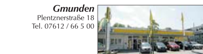
Gmunden Plentznerstraße 18 Tel. 07612 / 66 5 00