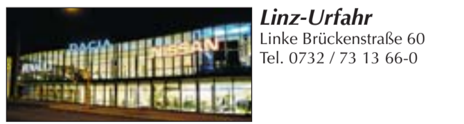
Linz-Urfahr Linke Brückenstraße 60 Tel. 0732 / 73 13 66-0