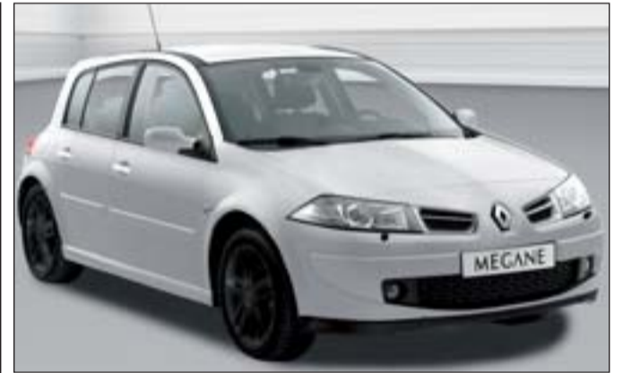
Kraftvoll, rassig, souverän: Renault Megane „White Magic“

Seit über 40 Jahren arbeitet Renault Sonnleitner im Dienst der Renault-Kunden. Im Jänner 2002 kam noch die Marke Nissan hinzu. Nissan stellt als Konzernmarke von Renault eine ausgezeichnete Ergänzung dar. Derzeit wird Nissan in Leonding, Wels, Steyr, Haid, Eferding, Braunau und Gmunden vertreten. Mit Jänner 2006 kam Dacia hinzu. Die in Rumänien beheimatete Marke gehört ebenfalls zum Renault-Konzern und rundet das Angebot im unteren Preissegment ab. Trotz dieser Expansion ist die Familie Sonnleitner sehr darauf bedacht den familiären Charakter der Firma aufrecht zu erhalten, denn nur wer seine Kunden kennt, kann auch wirklich auf sie eingehen.