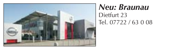
Neu: Braunau Dietfurt 23 Tel. 07722 / 63 0 08