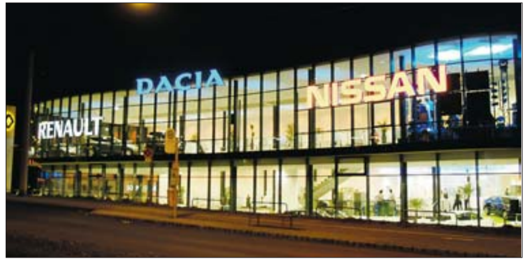
Sonnleitner Urfahr: Architektonisches Musterbeispiel für moderne Autopräsentation

Als besonderes Highlight legt Sonnleitner