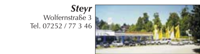
Steyr Wolfersstraße 3 Tel. 07252 / 77 3 46