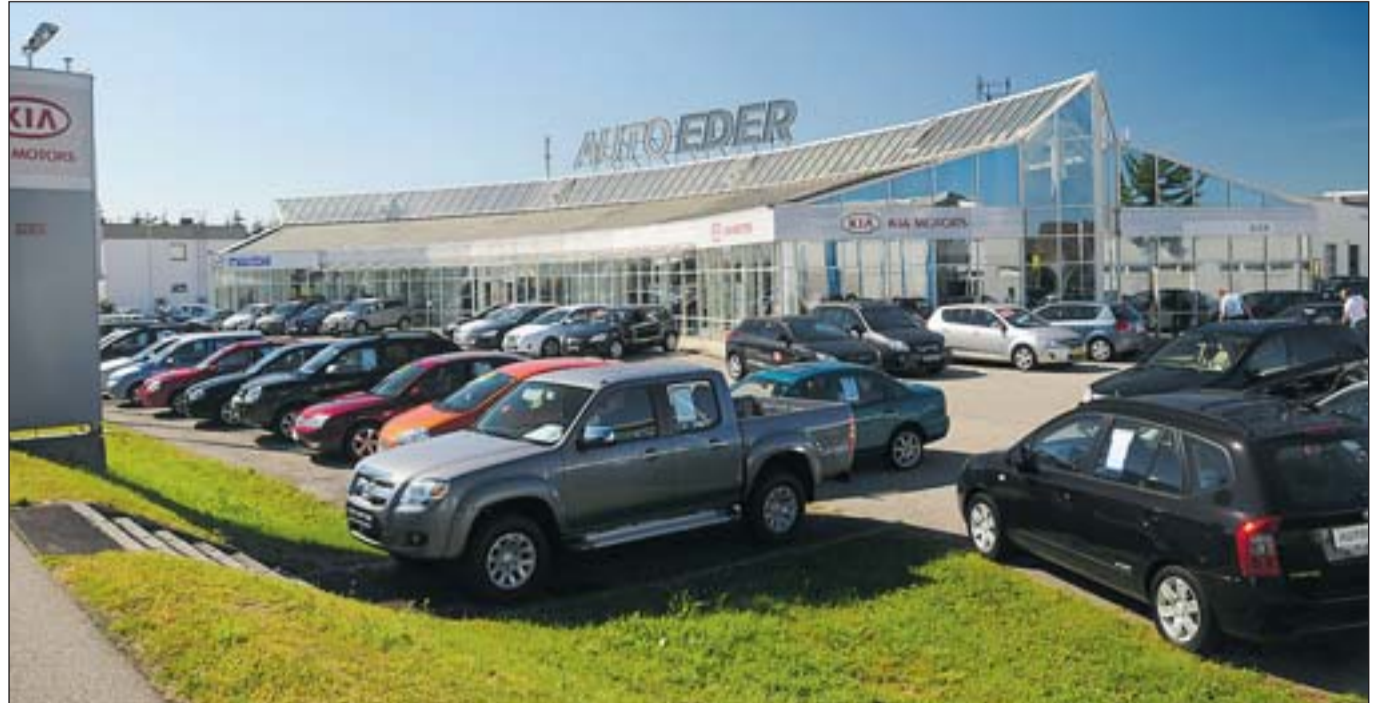
Kia- und Mazda-Händler mit strategisch günstiger Lage an der Trauner Kreuzung Nähe Plus City Pasching.

Die Übernahme des Autohauses Dallinger im März 2006 war für Auto Eder der wichtigste Schritt in seiner Firmengeschichte. Eine Übernahme, die für beide Seiten die optimale Lösung darstellte und einen Neustart für das Autohaus an der Trauner Kreuzung bedeutete.