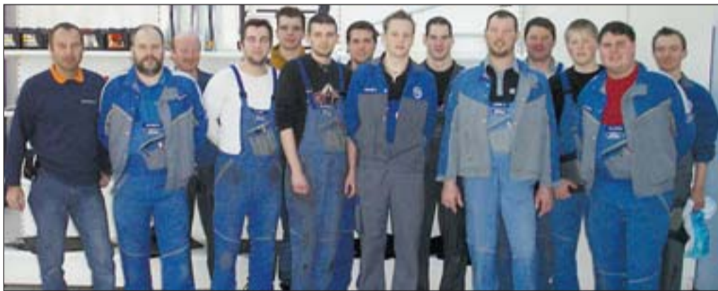
Das Werkstattteam vom Autohaus Danninger