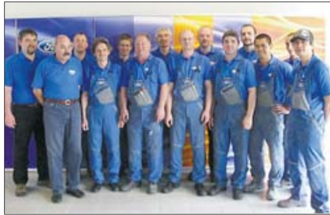
Spezialisten leisten Besonderes: das bestens geschulte Werkstatt-Team.