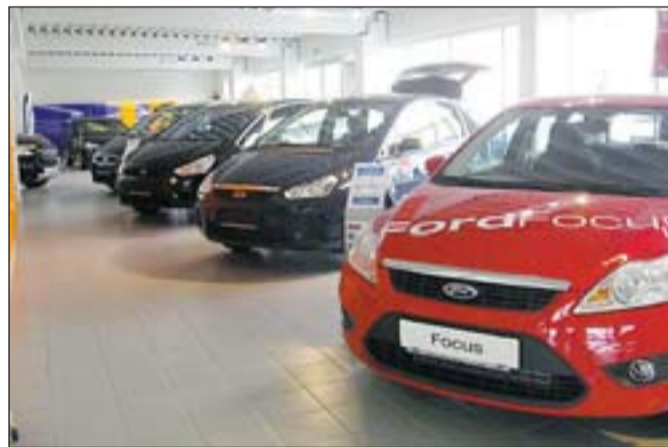
Neuwagen-Präsentation im neuen Schauraum.

fred Pössenberger gelten als die Ford-Spezialisten von Ka bis Transit und haben für alle