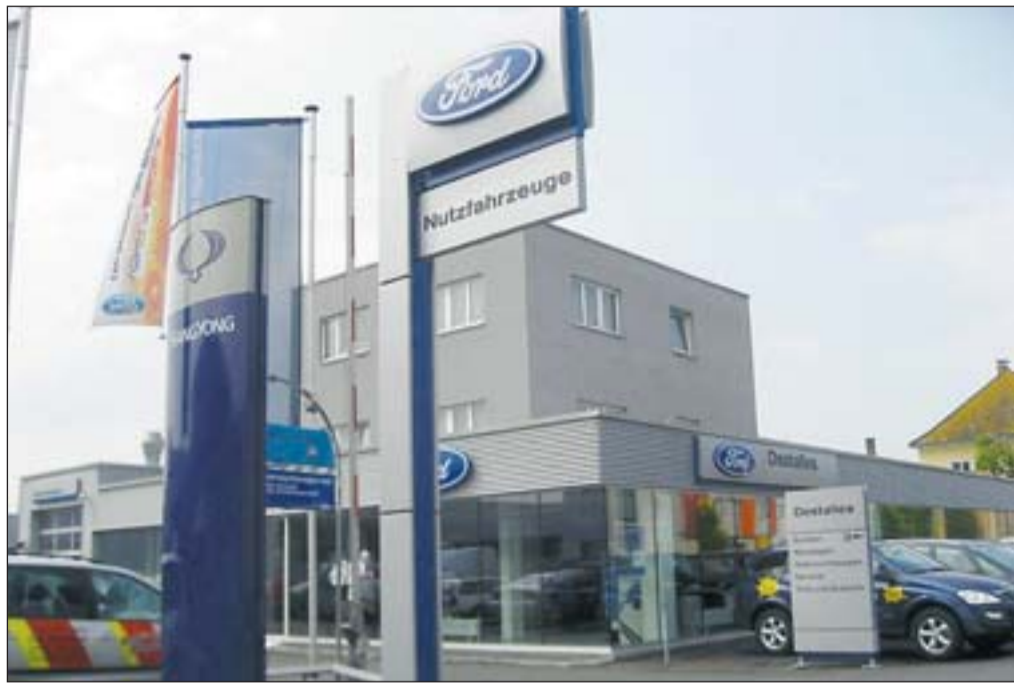
Traditionsreiches Autohaus im Herzen von Linz nahe Chemie-Kreisverkehr.

4020 Linz, Fröbelstraße 20, Tel. 0732 / 66 53 63, Fax 0732 / 66 53 63-20 www.ford-destalles.at info@ford-destalles.at www.ssangyong4you.at